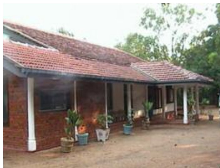
Foto 5: Het Moneragala trainingscentrum, de officiële opening vindt plaats op 1 januari 2006

Het hele proces is erop gericht om armoede te bestrijden door middel van duurzame trainingen. Voordat de jongeren trainingen kunnen volgen, moeten ze lid worden van een club (onder leiding van de SFF) in hun dorp. Door middel van deze clubs krijgen de jongeren de mogelijkheid om groepjes te vormen ingedeeld naar vaardigheden en persoonlijke interesses. Binnen de groep krijgen de jongeren telkens verschillende rollen toegekend, de ene keer als lid, de andere keer als leider van een club. Na zes maanden in de club te hebben gezeten worden ze toegelaten tot het trainingscentrum. Er zijn reeds 15 clubs gevormd in 15 dorpen en 300 jongeren zijn geselecteerd voor toelating tot het trainingscentrum.