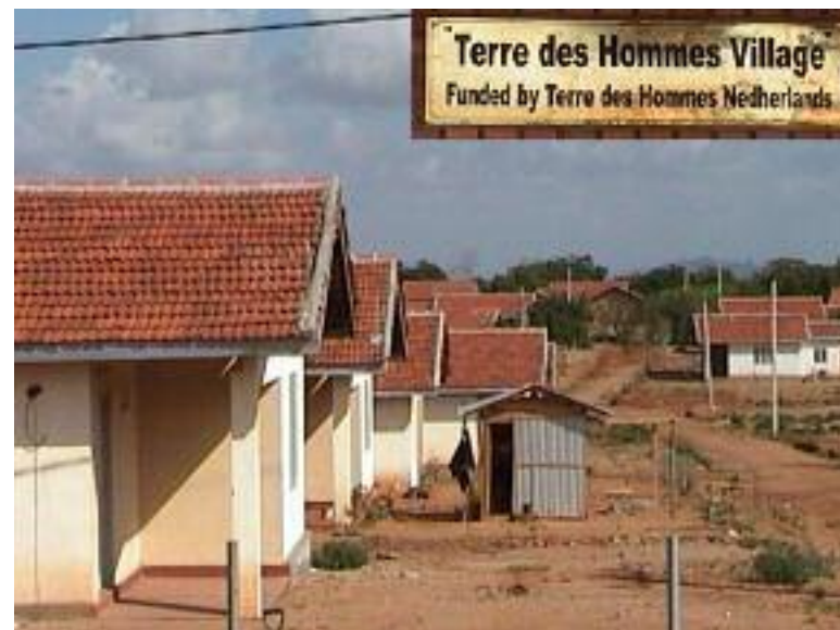
Foto 3: Terre des Hommes Village mede mogelijk gemaakt door Stichting Nijkerk Helpt Nu