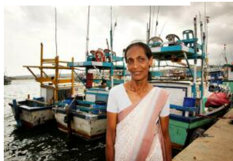
Foto 9: Een lid van de vrouwenbank