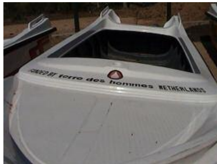
Foto 18: Boven: een grote boot Onder: De opening van de Kirinda werkplaats

De grond om deze werkplaats op te bouwen is nog niet gekocht. De productie van de boten vindt plaats in tijdelijke huisvesting.