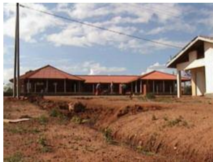
Foto 6: De gemeenschapscentra bevinden zich op een centrale plek in het dorp