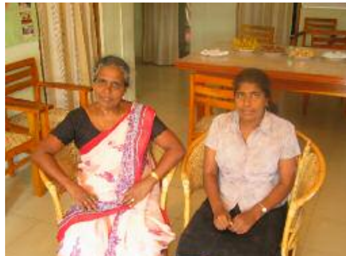
Foto 13: Leningen worden altijd afgesloten met minstens één getuige erbij