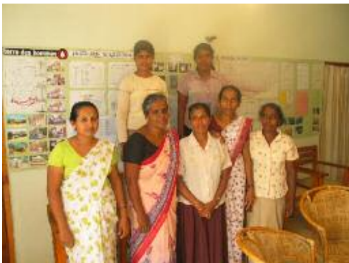
Foto 10: de bankiers